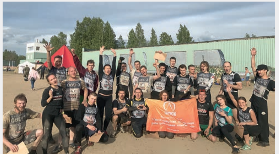
Счастье есть! Когда добежали до финиша

«Прошедшая «Гонка Героев» для меня была уже второй по счету. В прошлом году было тяжело и психологически, и физически проходить испытания, да и погода подкачала. А в этом году уже был готов ко всему, и поэтому все прошло легко. Особенно впечатления остались от водных препятствий... С нетерпением буду ожидать следующую гонку».