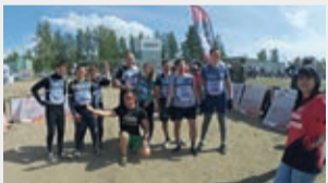
На старте: еще полные сил

«Это была моя первая «Гонка Героев». Я лишь примерно знала от коллег, как там все организовано, и не подозревала, что это окажется так тяжело! Ползать под танком или прыгать в воду с высоты – не сложно, а вот бесконечный бег по песку, кочкам, в гору... Я выдохлась через 200 метров. А пробежать надо было 11 километров! В своем взводе я была «слабым звеном», самой медленной «героиней». Было очень приятно, что остальные участники не бросили меня: постоянно кто-то из них бежал рядом, подбадривал, давал руку, в один момент двоим молодым людям пришлось меня нести! Если бы не команда, я бы точно сошла с дистанции. А в итоге мы финишировали все вместе, я прошла большую часть препятствий и даже получила удовольствие от гонки (особенно от горячего душа после нее!). Пока что есть мысли участвовать в следующем году, но уже подготовиться – тренировать выносливость и физическую форму, чтобы ничего не подвести!»