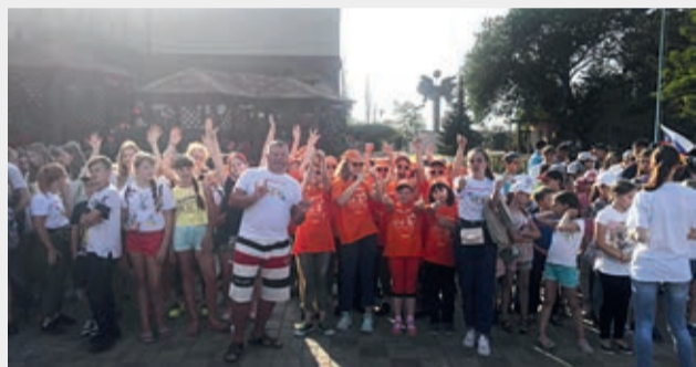
Отряд ЛОЭСК – всегда с оранжевым настроением

В конце июня закончилась первая смена в детском летнем лагере в поселке Заозерное возле Евпатории, где отдыхали 20 детей ЛОЭСК. Отдых в Крыму за счет компании для детей сотрудников организуют уже четвертый год подряд. От каждого филиала в Крым отправились трое детей, еще двое – из Центрального аппарата.