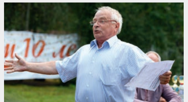
«Военно-патриотические сборы» в Лосево, 2014 год