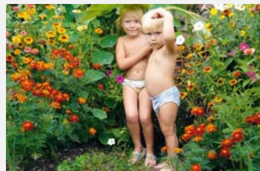
Фото Ксении Бизяевой «Дети – цветы жизни»

Напоминаем, что на конкурс принимаются фотографии как в «бумажном», так и в электронном виде. Снимки можно присылать по обычной и электронной почте. По обычной почте вы можете направлять работы по адресу: 195197, Санкт-Петербург, Полостровский пр., дом 47, лит. А, ОАО «ЛОЭСК», Грязновой М.Ю. На конверте обязательно пометка «На фотоконкурс». По электронной почте высылайте работы на адрес: Kravtsova@uek.spb.ru . Обязательно обозначьте тему письма – «На фотоконкурс».