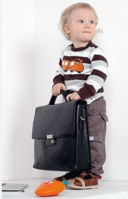
«ТОП-100. Кадровый резерв ЛОЭСК»