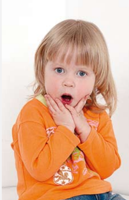
«Изменения в законодательстве?!»