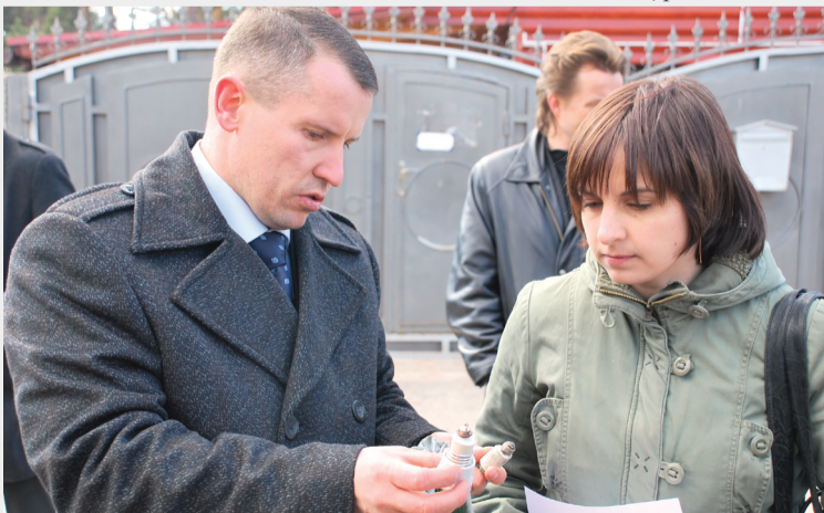
Фото Ирины Кравцовой «Майские жуки»