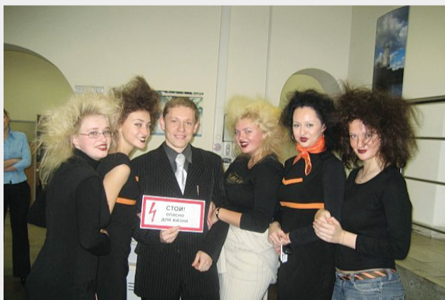
Фото коллектива Центра присоединений к электросетям «Конец рабочего дня»