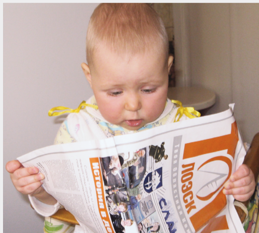
«Серьезная газеты для серьезных людей»