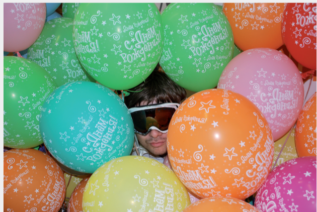
«Праздник, праздник!»

Уважаемые коллеги! Мы продолжаем публиковать некоторые фотографии присланные в редакцию нашей газеты.